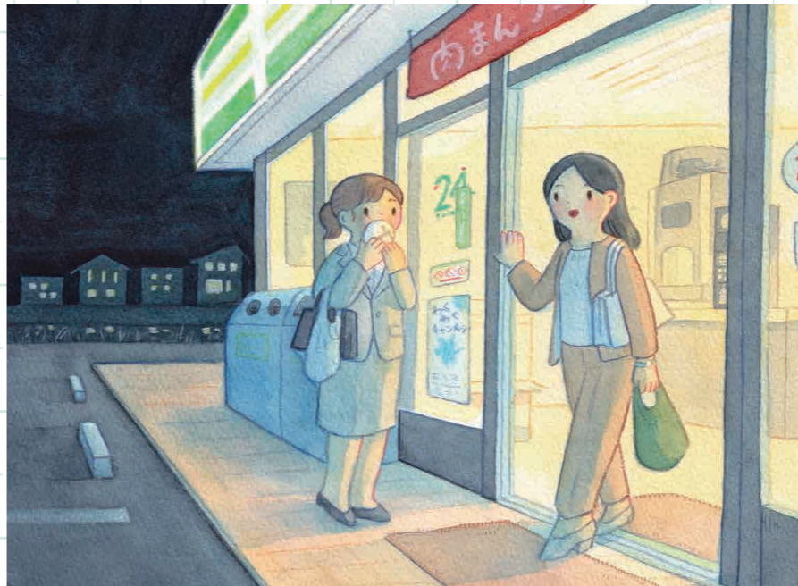
『会社帰りのコンビニ』