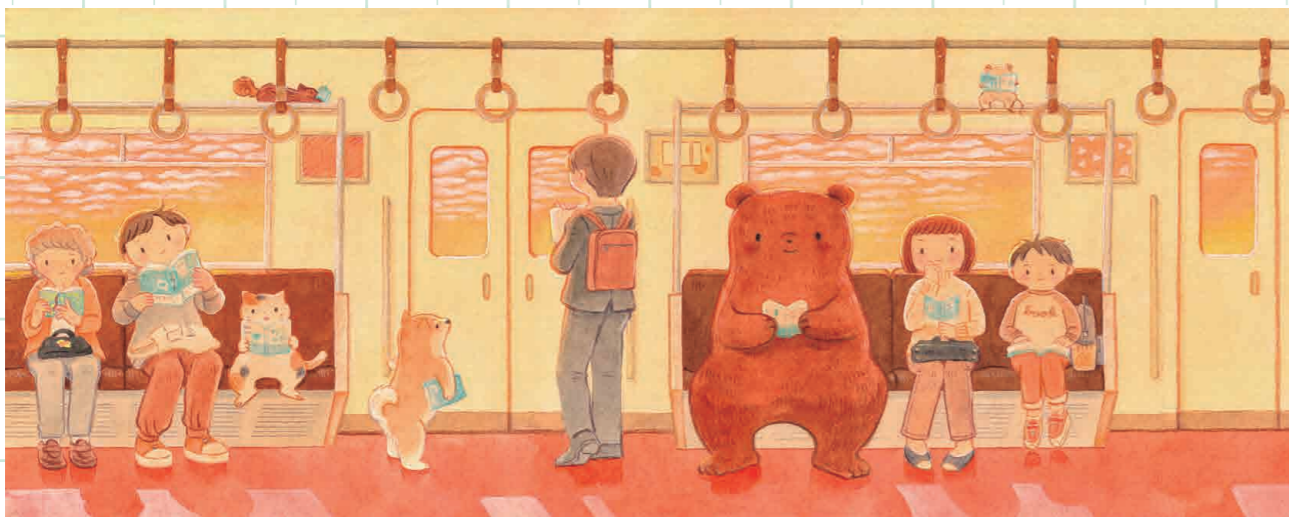
『夕方のでん車で読書』

親元を離れることになった娘と見送る父です。朝の光らしくように、やわらかく表現しました。