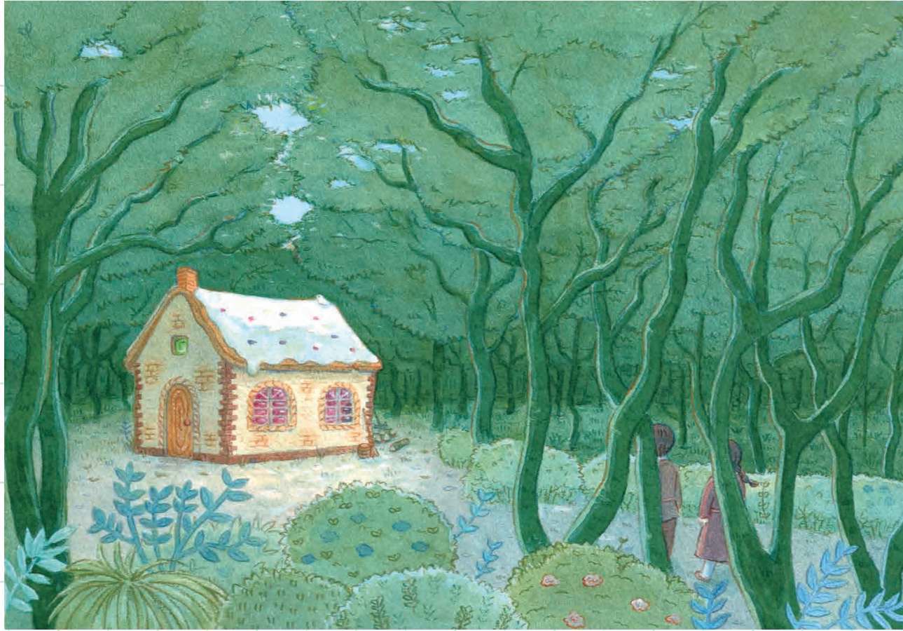
『ヘンゼルとグレーテル』

ファンタジーの世界でも、そこに生きている人の生活を感じる絵を描きたいと思っています。