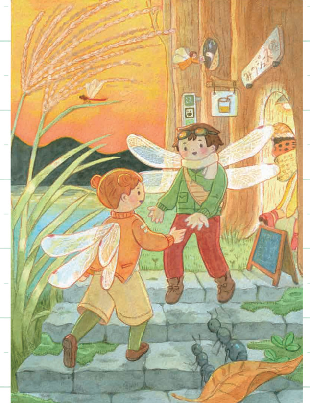
『トンボの妖精の町歩き』

流しそうめん機は回るプールの様だと思い、制作しました。artbook事務局様のイラスト集「FOOD2023」に掲載されました。