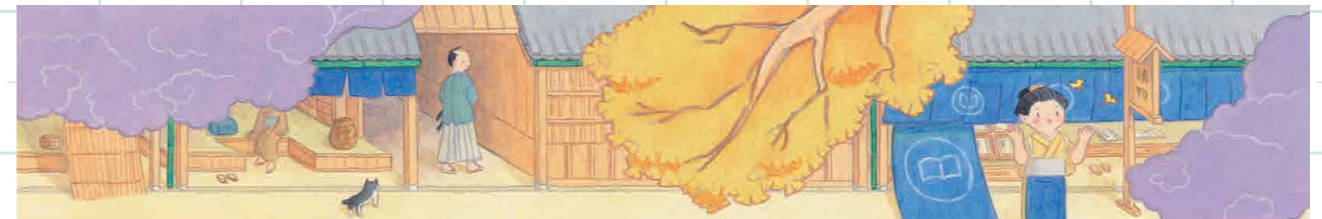
『江戸の町並み』(一部)

虫と妖精が暮らしている町で、妖精たちがデートをしている様子を描きました。秋の夕方を表現しました。