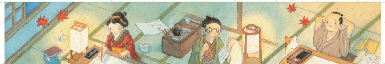
『江戸の作家志望たち』(一部)

「#オール讀物目次絵コンテスト」佳作受賞作品。江戸時代後期の町を調べ制作しました。