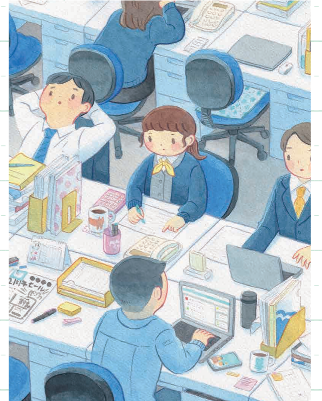
『中小企業の事務所』

仕事終わりに飲むおじさんたちです。お酒の場もほっこりしたテイストで表現できます。