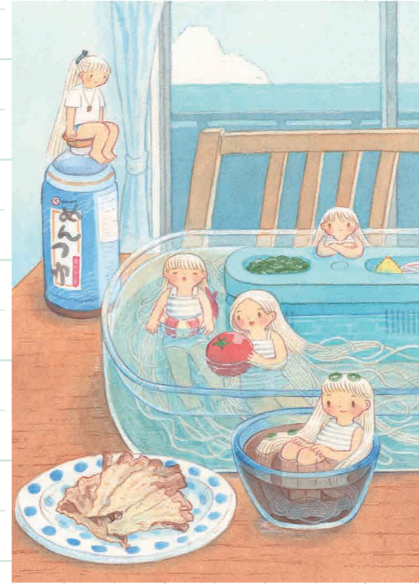
『そうめん達のプール遊び』